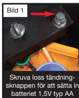
Skruva loss tändningsknappen för att sätta in batteriet 1,5V typ AA

Varning: Skyddet (glasdörren) på denna apparat är för att förhindra brandrisk eller brännskador och ingen del av den ska tas bort permanent. DET GER INTE FULLT SKYDD FÖR BARN. För fullständigt skydd för barn rekommenderar vi att ett brandskydd enligt BS 8423 ska monteras.